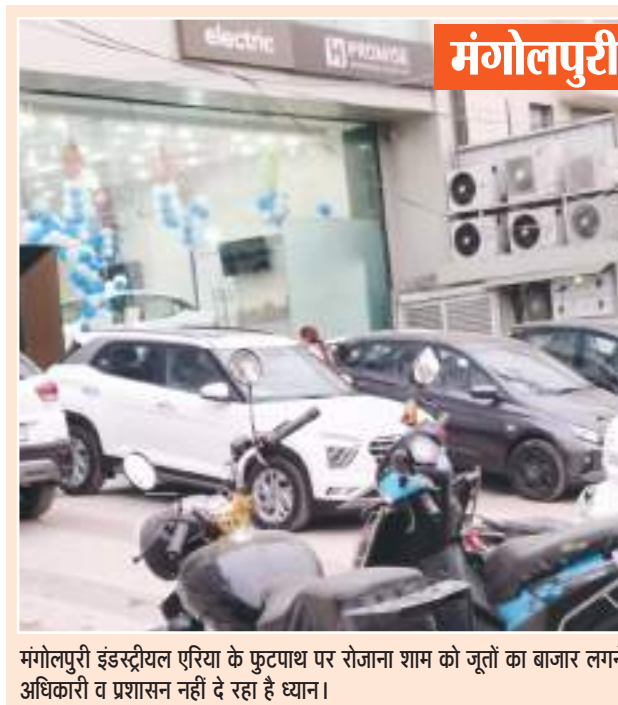
मंगोलपुरी: प्रशासन की अनदेखी...