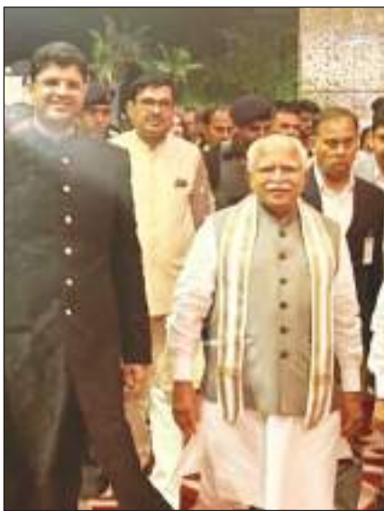
दुष्यंत चौटाला की शादी समारोह में शामिल हुए हरियाणा के सीएम मनोहर लाल खट्टर। डिटी सीएम दुष्यंत ने किया स्वागत।